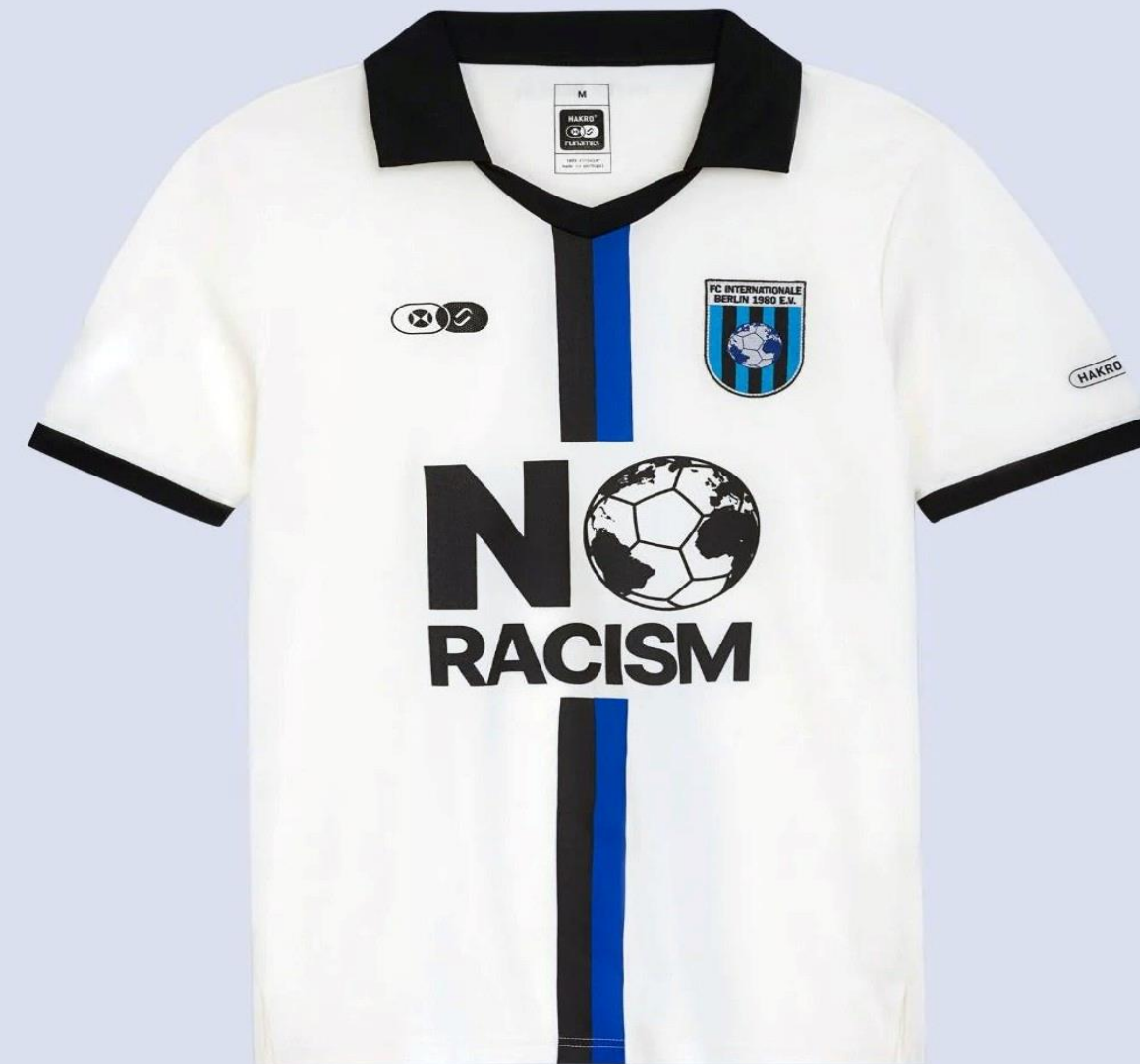
DAS TRIKOT vom FC Internationale Berlin